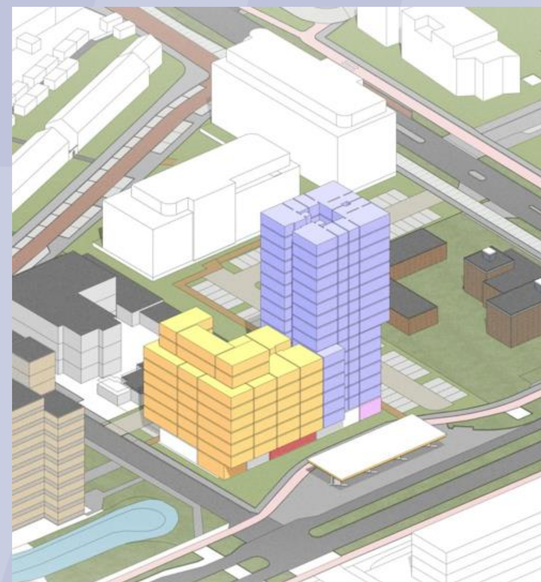
VARIANT 3 16 BOUWLAGEN