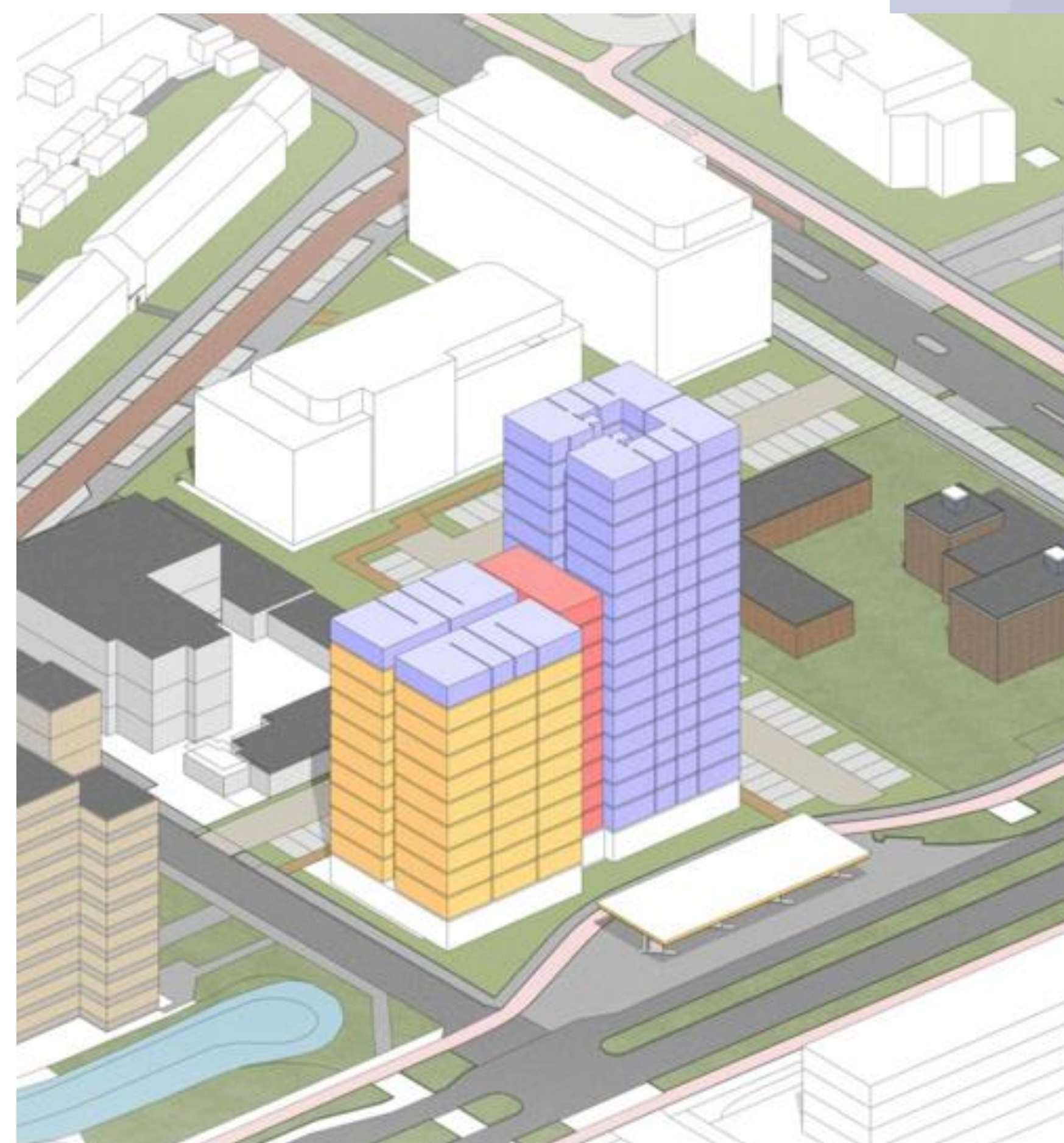
VARIANT 2 16 BOUWLAGEN