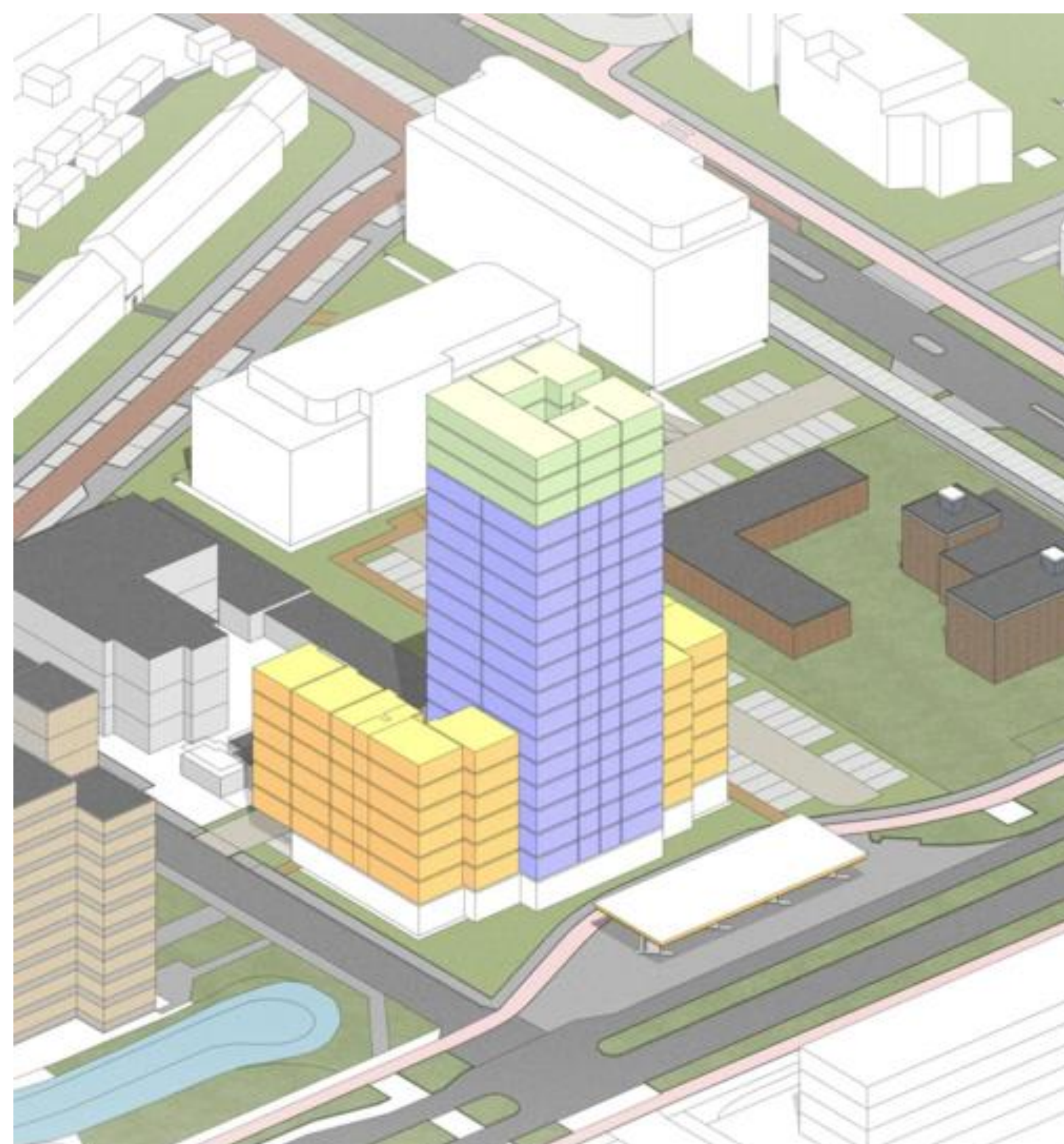
VARIANT 1 19 BOUWLAGEN